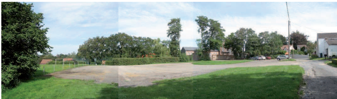
Figure 1: vue depuis la rue Doyen

Propriété communale, la place de Hèze est située au cœur du village et délimitée par la rue Félix Lacourt, la rue Doyen, l'ancienne école communale et un espace de jeux. Elle n'est donc pas traversée par une voirie et est théoriquement sécurisante pour les usagers doux. Cependant, elle est principalement utilisée comme espace de stationnement. Elle est en gravier avec une pastille de pelouse en son centre (voir Figure 1). La place n'est donc actuellement « utilisée » par les usagers doux que pour l'accès à l'espace de jeux.