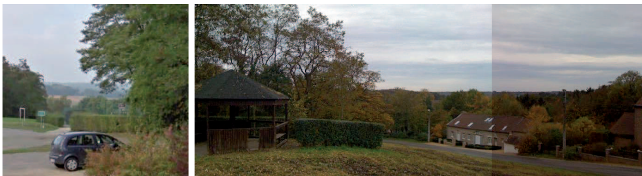
Figure 2: Vue en contrebas, depuis le parking (à gauche) et le belvédère (à droite)

Elle est située sur un point « haut » de Grez et donne une vue imprenable en contrebas. Un belvédère est d'ailleurs aménagé pour tenter de profiter de cette vue. Cependant, il est mal placé et mal entretenu (voir fiche MT-06).