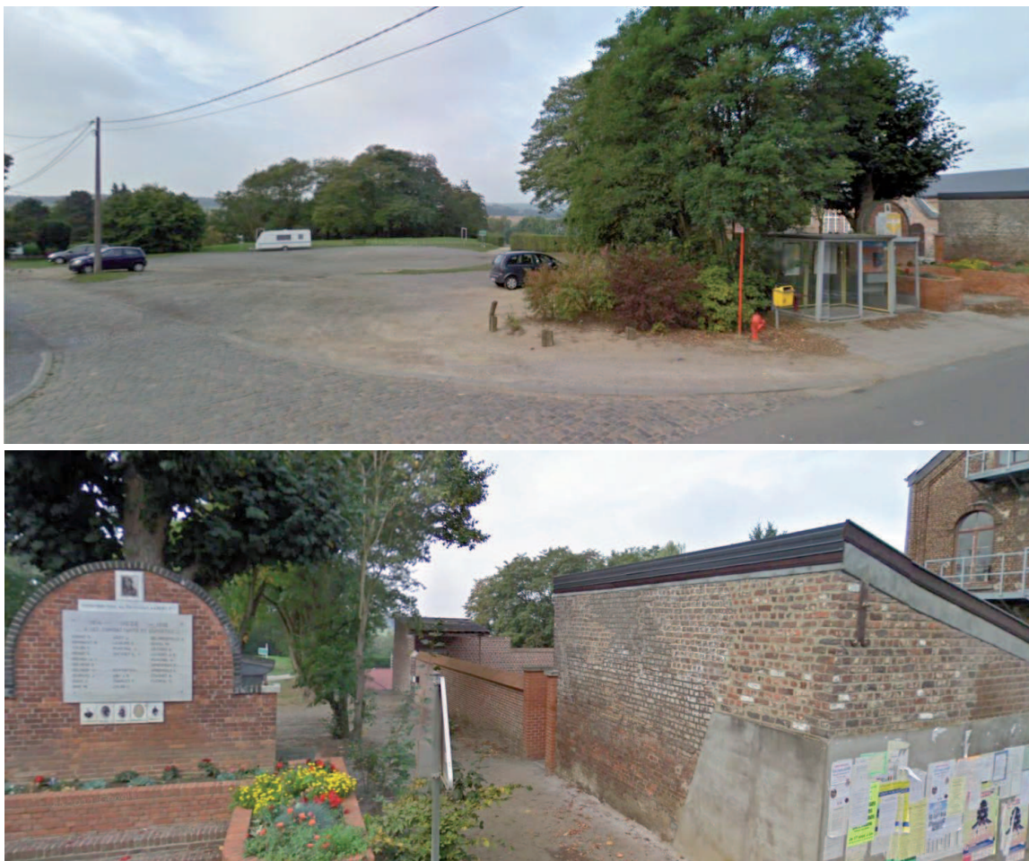
Figure 3: Vue depuis la rue Félix Lacourt (en haut) et sentier menant de la rue Félix Lacourt à l'arrière de la cour et à l'espace de jeux, en longeant le monument aux morts (situé à côté de l'arrêt de bus TEC)(en bas)

L'espace de jeux présent à côté de la place est analysé en détail dans la fiche MT-12. Il s'adresse à un public de 9 ans et plus. Des propositions de rénovation sont également faites dans cette fiche, dont l'aménagement d'une petite plaine de jeux pour les moins de 9 ans, afin que cet espace touche tous les âges.