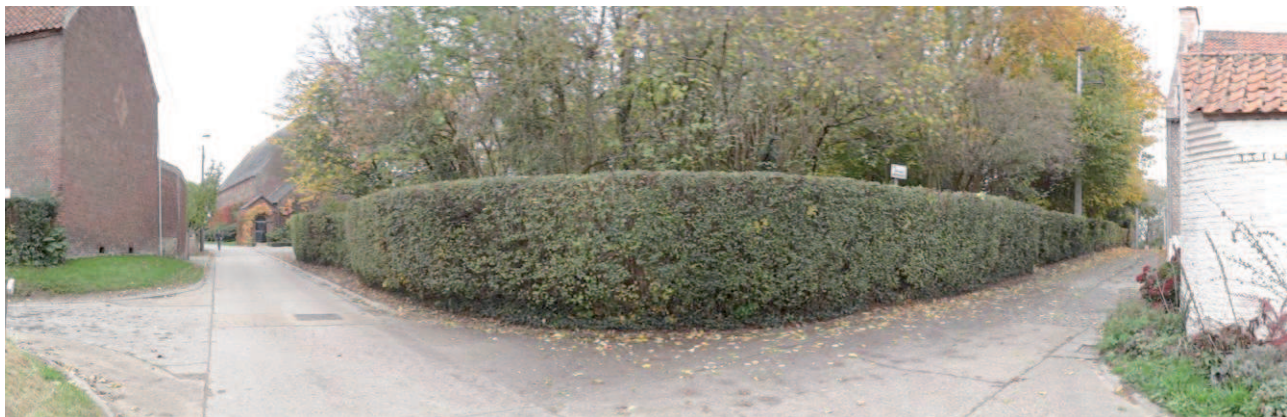
Figure 3 : Accès actuel du site (en haut), et pas de visibilité depuis le croisement de la rue Mornard et de la rue de la Bryle (en bas), pas de possibilités de stationnement (JNC AWP)