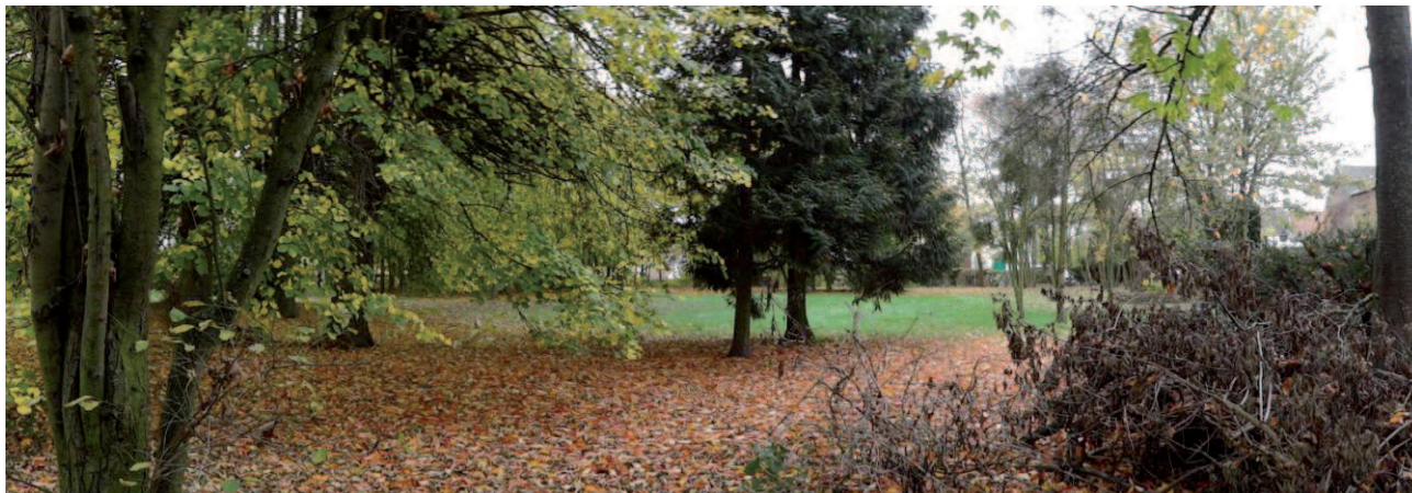
Figure 4 : Présence de beaux arbres mais espace peu ensoleillé et fermé sur lui-même (JNC AWP)