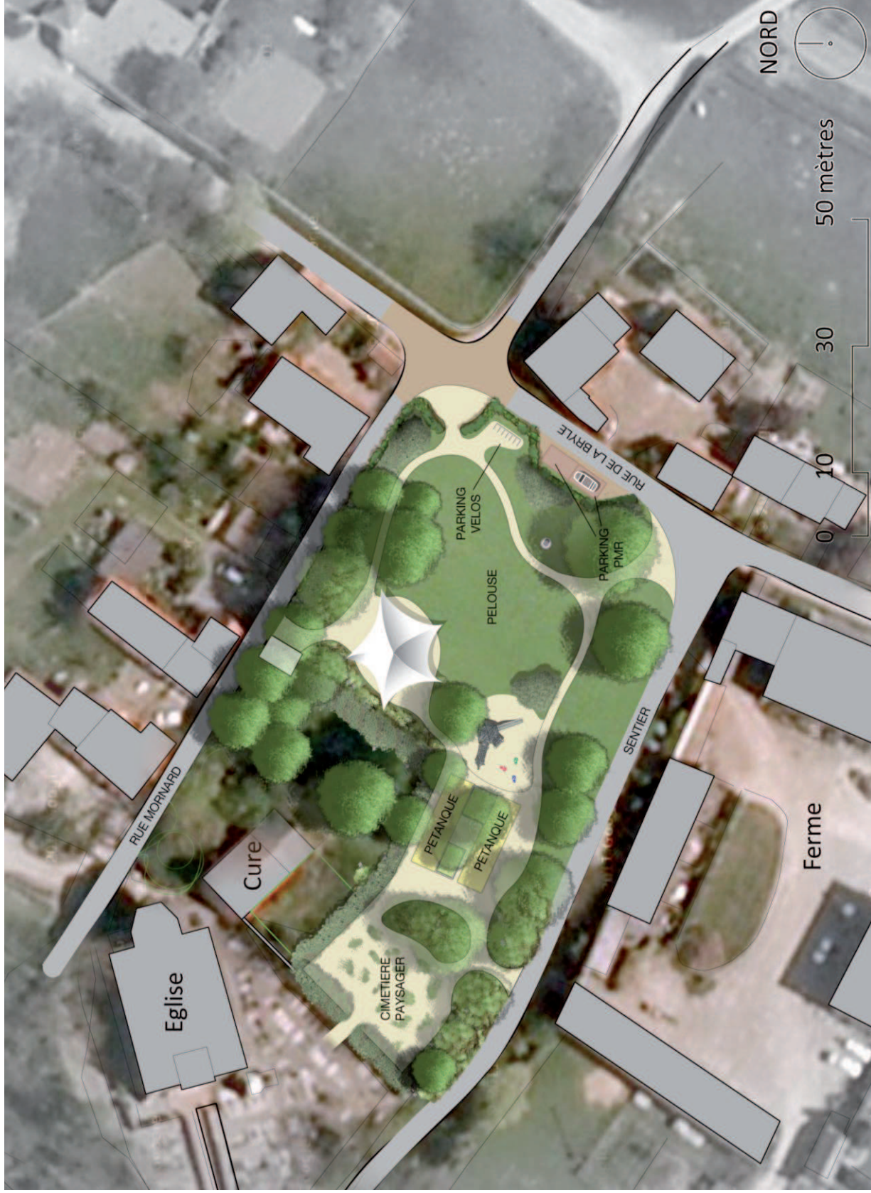
Figure 2: plan schématique des aménagements proposés