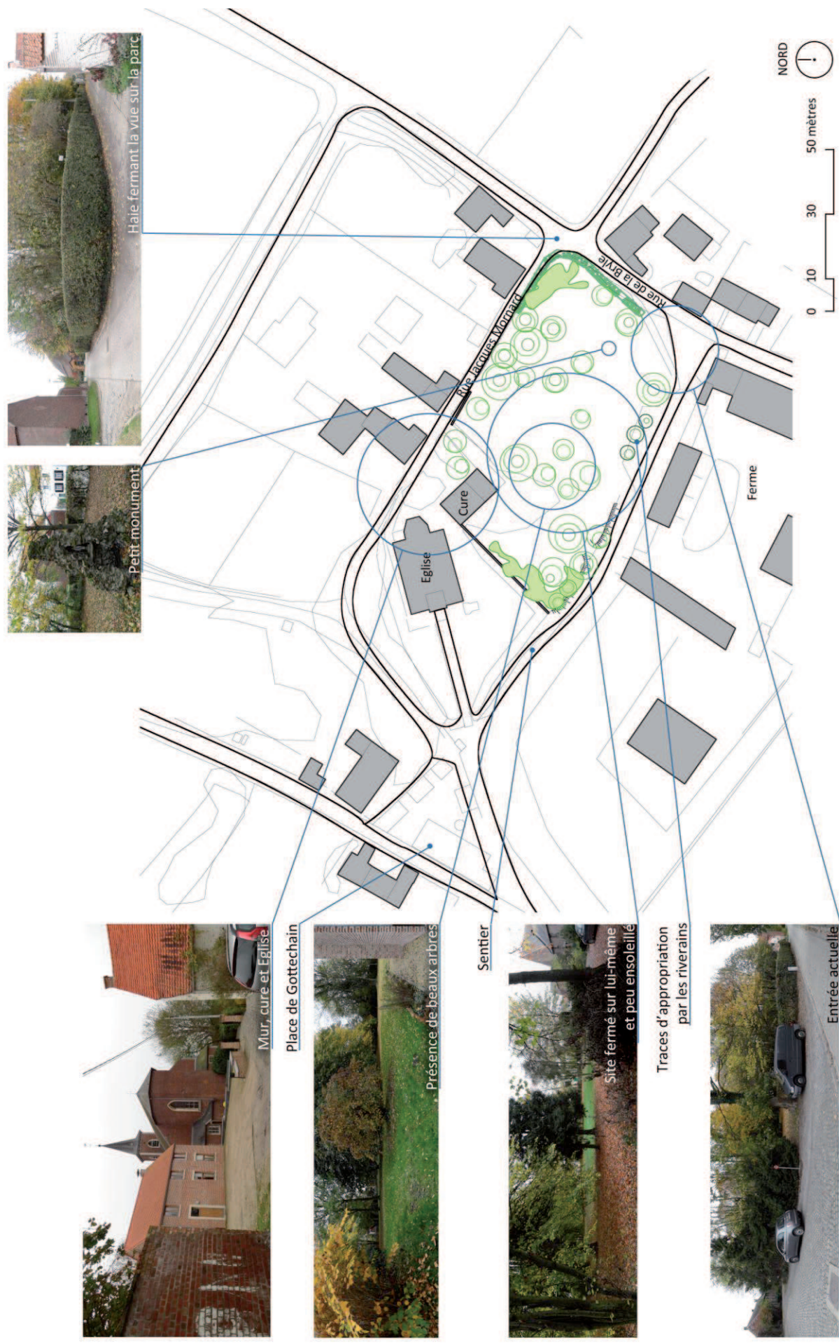
Figure 1 : plan schématique du site existant