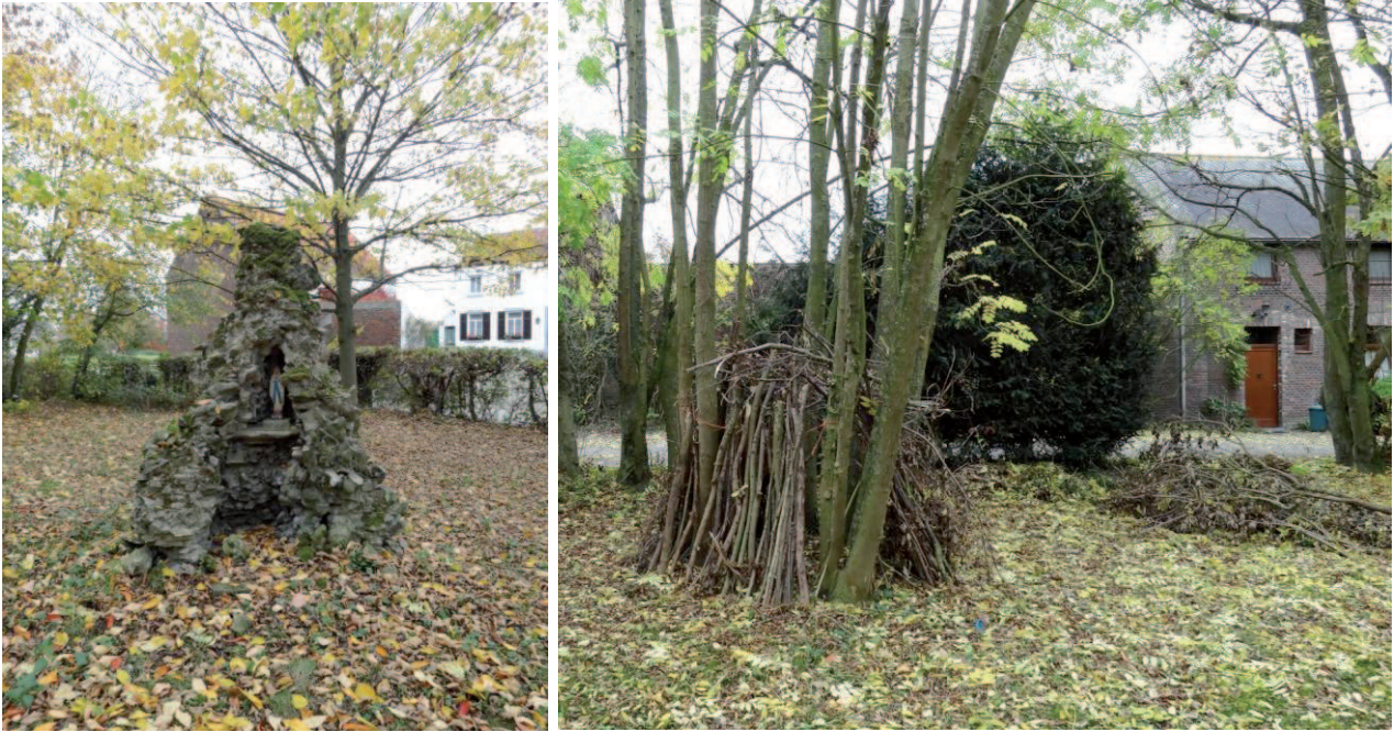
Figure 5 : Présence d'un petit monument (à gauche) et appropriation de l'espace par les riverains (à droite) (JNC AWP)