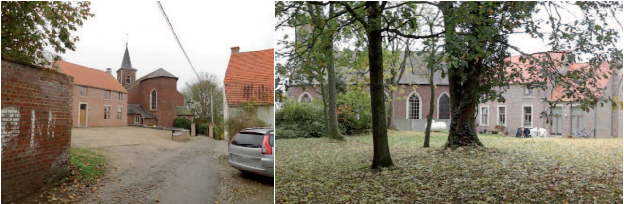
Figure 6 : Mur longeant le site au bout de la rue Mornard, et vue sur la cure et sur l'église (à gauche), mais pas de contact direct avec l'église (à droite) (JNC AWP)